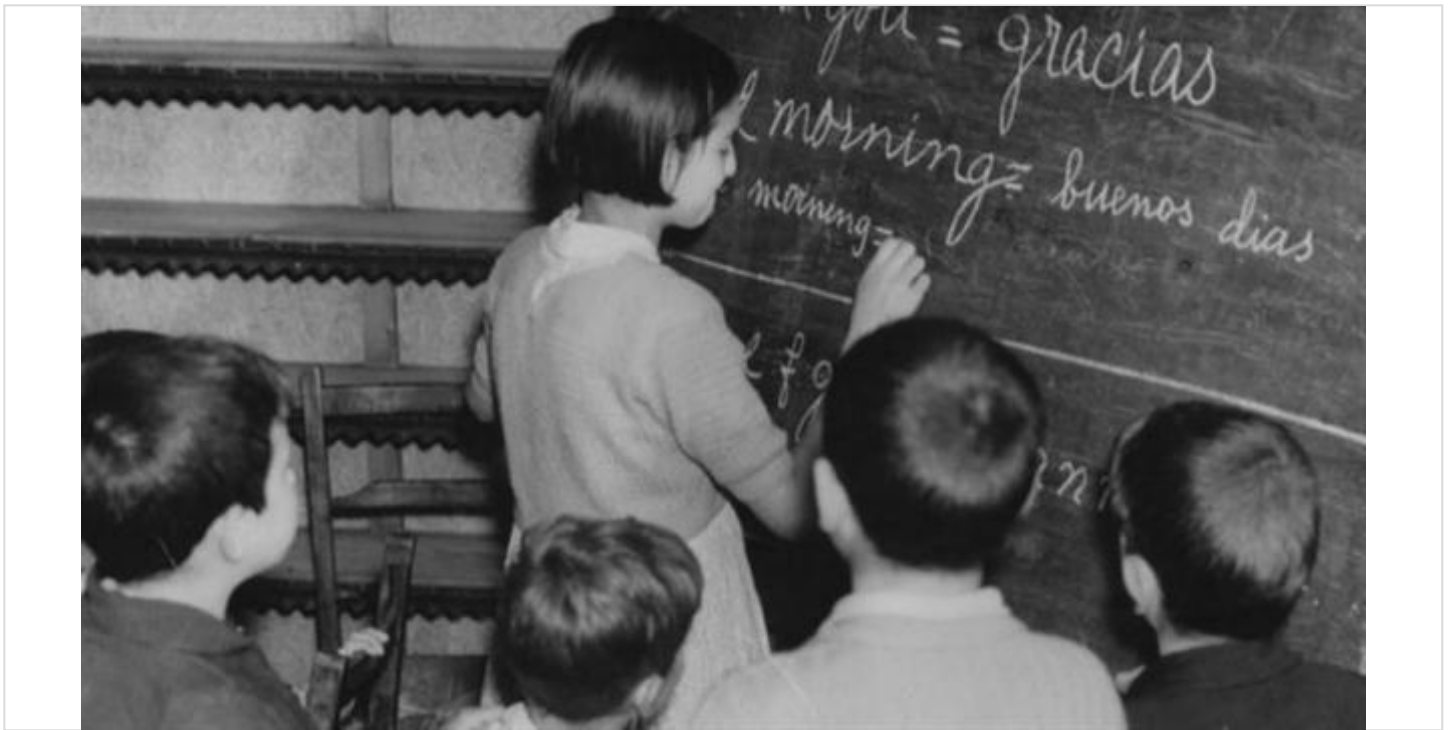
Más de 20 millones de personas estudian español en el mundo..

El inglés, el francés, el español y el alemán, en este orden, son los idiomas más estudiados como lengua extranjera según el primer informe Berlitz sobre el estudio del español en el mundo, elaborado en el año 2005.