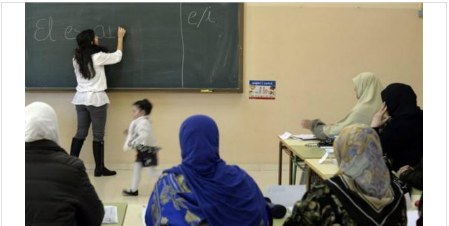
Junto al inglés y al francés, el español es uno de los idiomas más estudiados.

En las Antillas Holandesas, en el Caribe, el 59% de sus habitantes habla español y en Belice, América Central, lo hace el 52%.